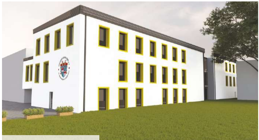
Wizualizacja PZS 4 w Wejherowie

W wyniku zadania powstanie trzykondygnacyjny budynek o powierzchni użytkowej ponad 2,6 tys. m 2 , w którym znajdzie się 15 w pełni wyposażonych sal dydaktycznych, w tym dodatkowe pracownie zawodowe branży mechanicznej i elektroenergetycznej, pomieszczenia sanitarne, gospodarcze, pokój nauczycielski, biblioteka oraz aula. Na dachu zostanie zamontowana instalacja fotowoltaiczna. Nowy budynek połą-