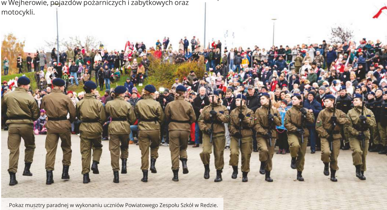
Pokaz musztry paradnej w wykonaniu uczniów Powiatowego Zespołu Szkół w Redzie.

Zwieńczeniem tego wyjątkowego dnia był koncert Zespołu „Last” - hard rock cover group. W Fabryce Kultury można było również wysłuchać wyjątkowego koncertu niepodległościowego „Rozumieć bohaterów Cezarego Paciorka z zespołem.