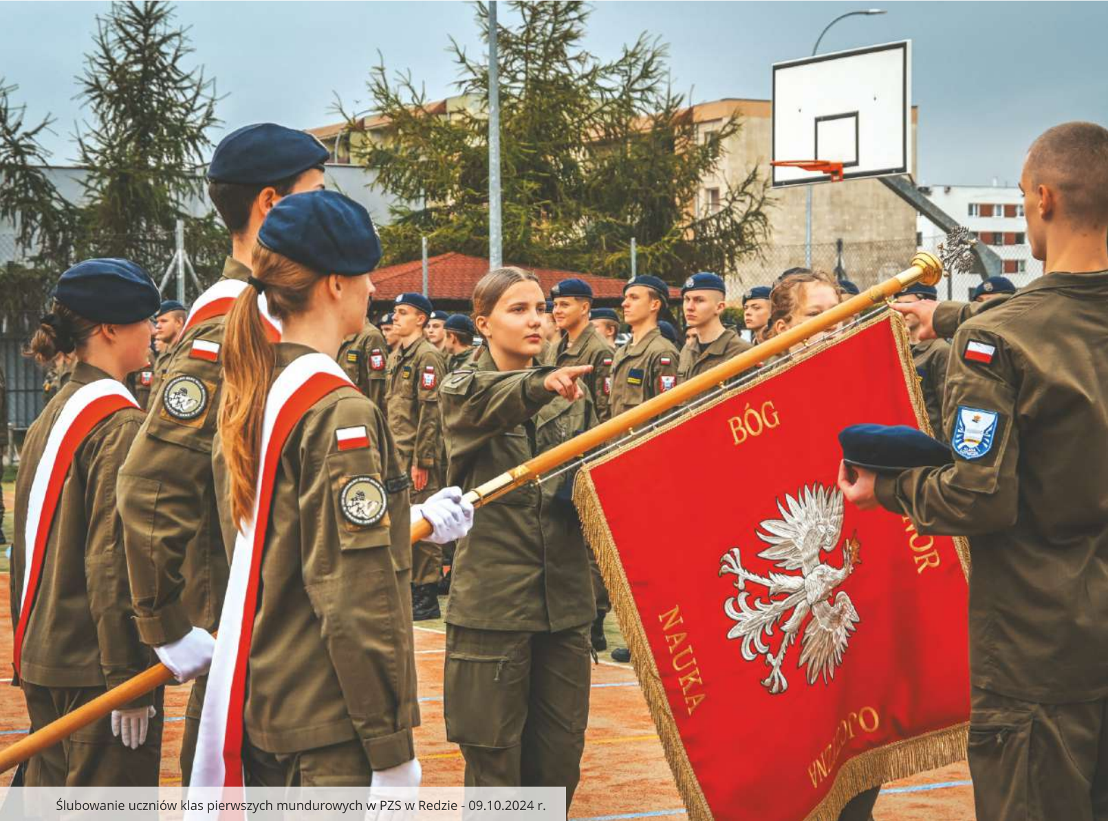
Ślubowanie uczniów klas pierwszych mundurowych w PZS w Redzie - 09.10.2024 r.