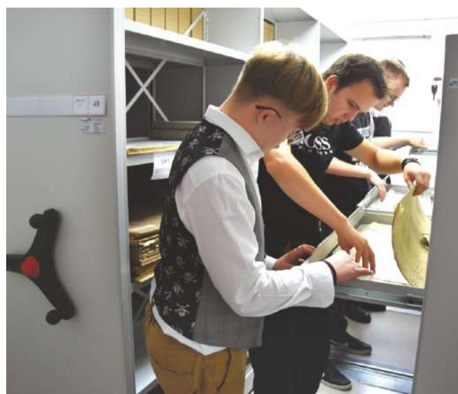
Uczniowie PZKS w Wejherowie podczas praktyk w zakładowym archiwum starostwa.