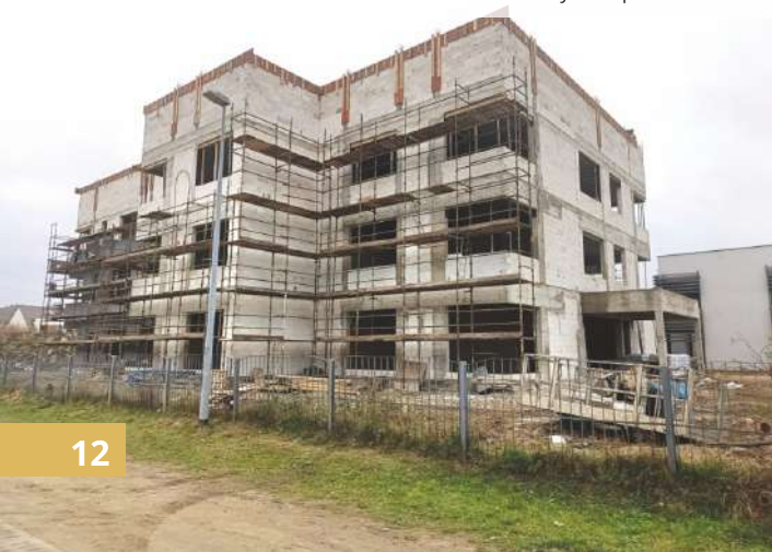
Obecny stan prac w Redzie

Koszt zadania to ponad 23 mln zł , z czego 20 mln zł stanowi dofinansowanie z Polskiego Ładu. Przewidywany czas zakończenia prac to koniec sierpnia 2025 r.