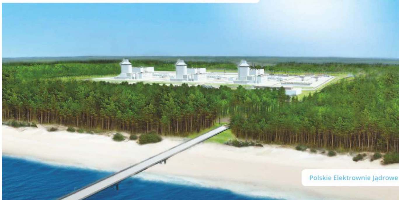
Poglądowa wizualizacja pierwszej elektrowni jądrowej w Polsce