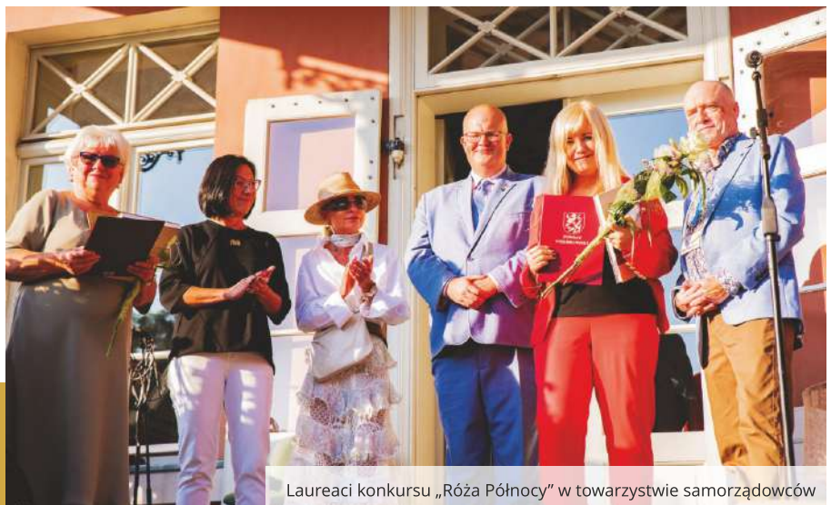
Laureaci konkursu „Róża Północy” w towarzystwie samorządowców

Zajmują się m.in. pomocą społeczną, wzbogacają ofertę kulturalną i sportową, popularyzują historię regionu oraz realizują zadania z zakresu profilaktyki zdrowotnej. Dnia 21 września w Parku Miejskim w Wejherowie przy Muzeum Piśmiennictwa i Muzyki Kaszubsko-Pomorskiej odbył się festyn, podczas którego wręczono nagrody w konkursie „Róża Północy” wyróżniającym się organizacjom pozarządowym z Powiatu Wejherowskiego.