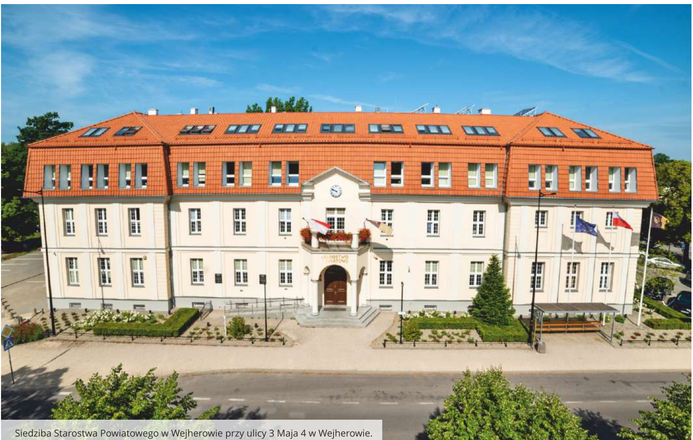
Siedziba Starostwa Powiatowego w Wejherowie przy ulicy 3 Maja 4 w Wejherowie.