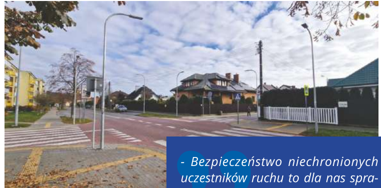
Wyniesione skrzyżowanie u zbiegu ulic Granicznej i Broniewskiego w Wejherowie

Zakończyły się prace remontowe na ulicy Granicznej w Wejherowie, które przyczynią się do poprawy bezpieczeństwa i ochrony pieszych uczestników ruchu. Inwestycja realizowana była przy wsparciu środków rządowych.