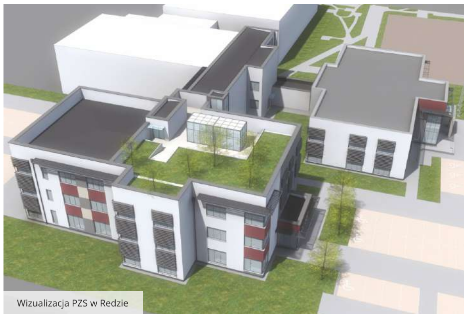
Wizualizacja PZS w Redzie

Podczas Powiatowej Inauguracji roku szkolnego 2024/2025 w PZS w Redzie odbyło się uroczyste podpisanie i wmurowanie aktu erekcyjnego pod budowę kompleksu 20 klasopracowni do przedmiotów zawodowych i ogólnokształcących. W nowoczesnym, trzykondygnacyjnym obiekcie, który zostanie połączony łącznikiem z budynkiem oddanym w 2019 r., znajdzie się także m.in. gabinet pedagoga, psychologa, doradcy zawodowego, stomatologa, a także biblioteka multimedialna i pokój nauczycielski. Z myślą o uczniach kierunku technik architektury krajobrazu na dachu budynku powstanie zielony dach oraz przestrzeń, która zostanie efektywnie zagospodarowana. Powstanie laboratorium, szklarnia i pasieka, a na pozostałej części zostanie zainstalowana instalacja fotowoltaiczna.