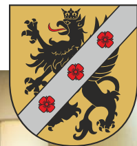
Radni Powiatu Wejherowskiego VII kadencji